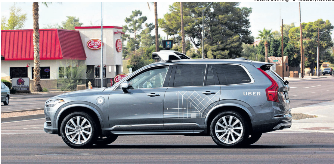
Natalie Behring - 1º.dez.17/Reuters

A Uber disse estar cooperando plenamente com as autoridades e suspendeu seus testes com veículos autôno-